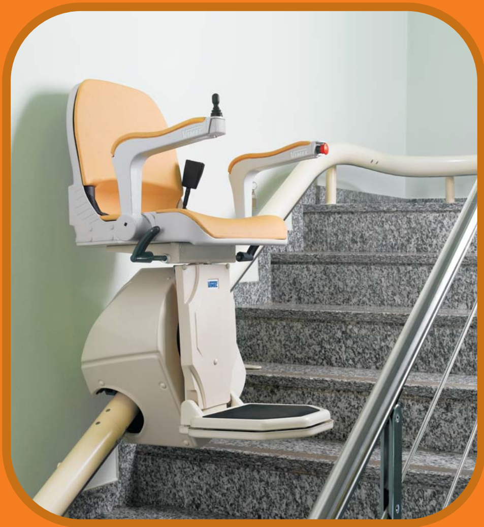
Capri Krzesełko schodowe z torem z krzywoliniowym